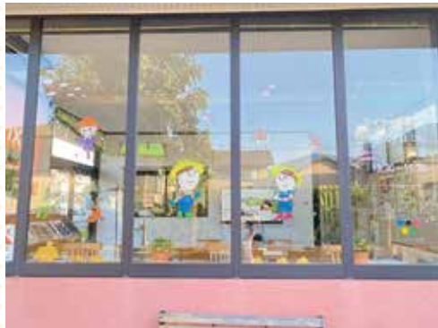
This month's Show Window

今月のショーウィンドウは「実りの秋」です。 待ちに待った新米の季節がやってきました。ホームくんとウェルちゃんもちょっぴりお手伝いしています。 さあ、美味しいご飯をいただきましょう。