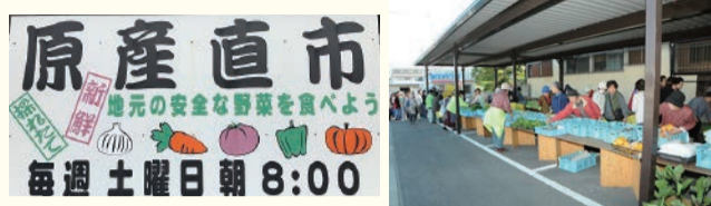
当日出品する野菜が、お天気によっては多少変わることがありますが、ご了承下さい。