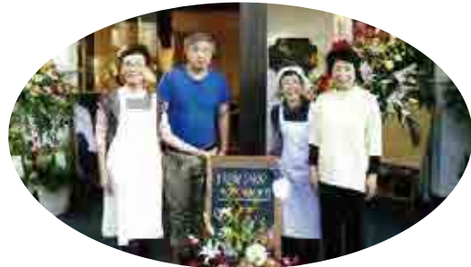
ご来店お待ちしております！！