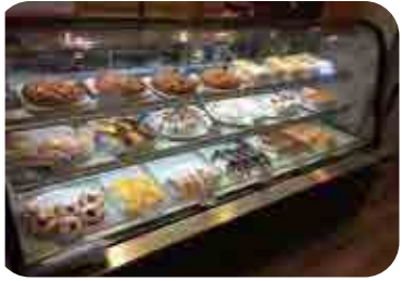
ケーキの種類もバージョンアップしました！